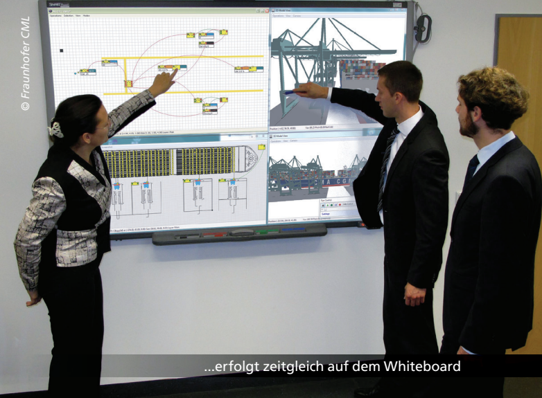
...erfolgt zeitgleich auf dem Whiteboard