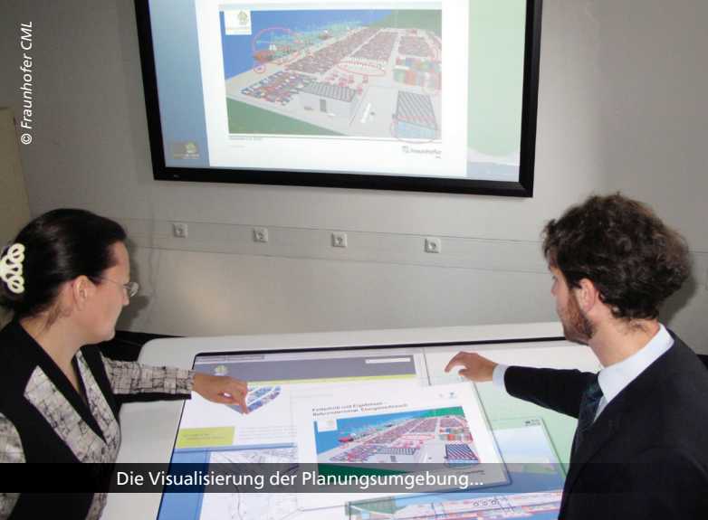
Die Visualisierung der Planungsumgebung...